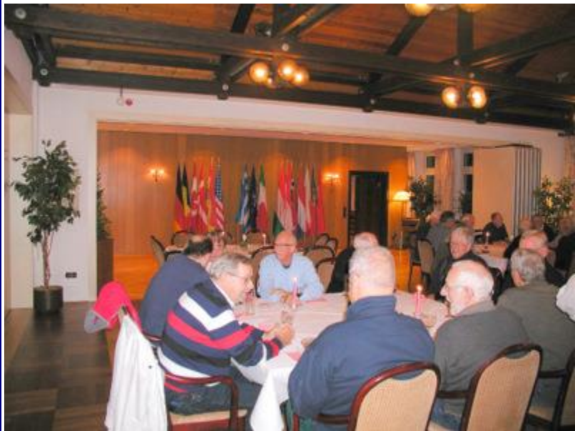
Det første måltid efter ankomsten til Geilenkirchen blev indtaget i basens smukke officersklub.