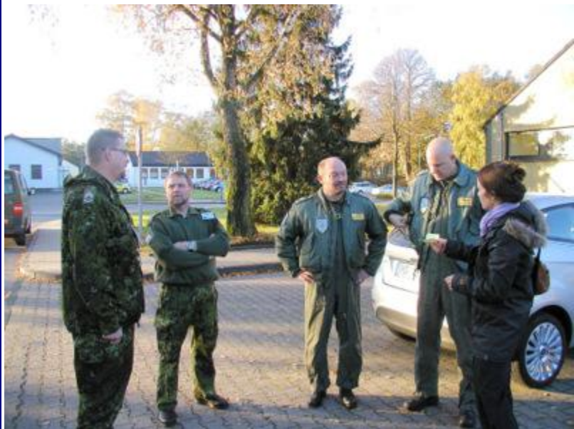
Der blev ydet en fantastisk flot service fra basens danske