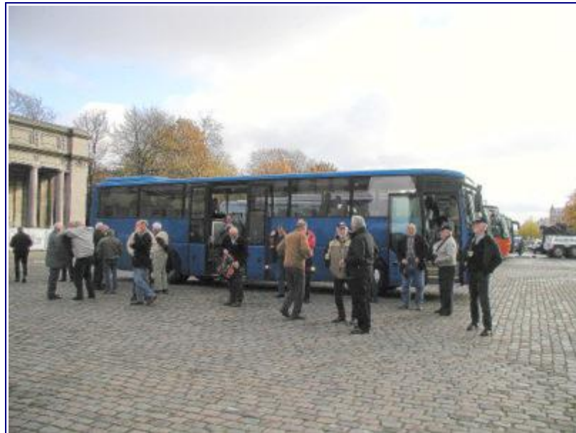
Ankomst til museerne i Bruxelles.

Desuden besøgte Camp Vogelsang, der af Hitler blev beordret opført midt i 1930'erne til uddannelse og opdragelse af en ægte, arisk ungdom. I dag er det store og meget smukke område i Eifel-bjergene udlagt som nationalpark.