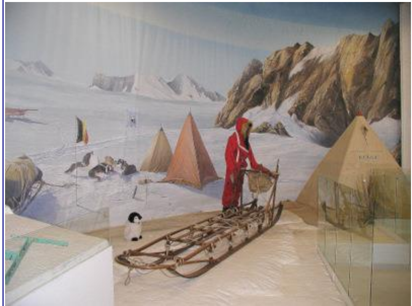
Der kunne godt hentes inspiration til FLYHIS' egne udstillinger i Stauning.