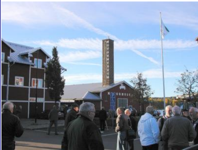
Turens første besøg gjaldt Motormuseet i Motala. Det er et sted, hvor nostalgien virkelig får lov at udfolde sig. Billederne herunder kan kun give et ganske svagt indtryk af dette, og desværre kan pensionisternes mange begejstrede "Ih-Åh!"-udbrud ikke gengives.