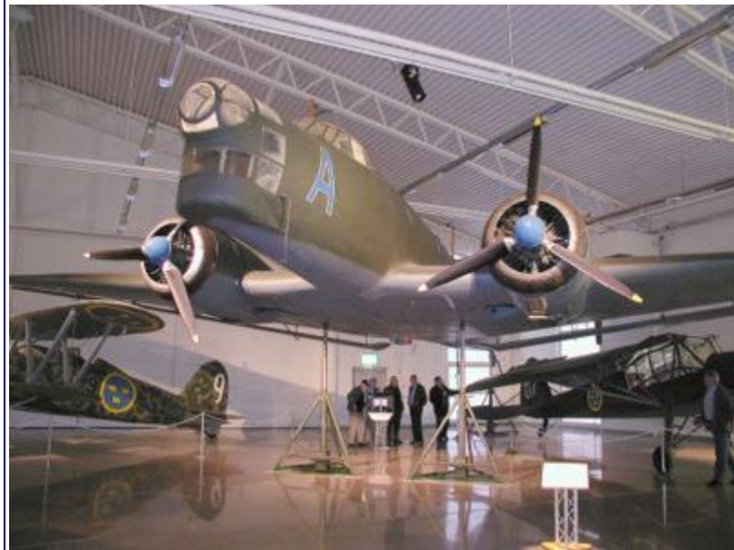
Et helt specielt indslag i udstillingen drejer sig om den svenske DC-3'er, som den 13. juni 1952 blev skudt ned over internationalt farvand i Østersøen af russiske jagerfly.