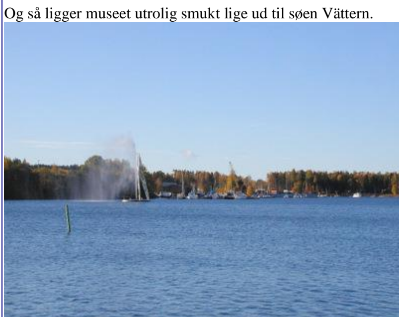
Og så ligger museet utrolig smukt lige ud til søen Vättern.