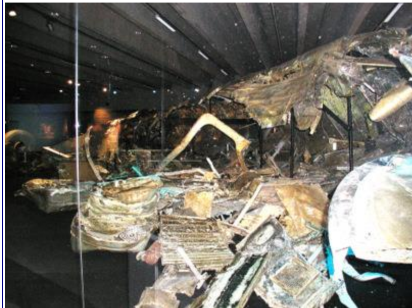
Den sidste dag på turen gjaldt et besøg på Forsvarsmuseet i Stockholm.