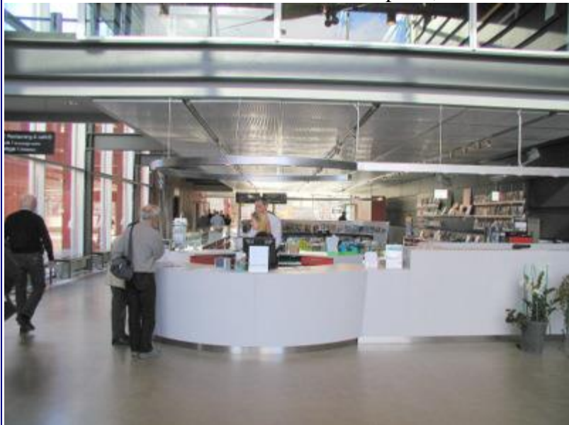
Herunder ses den smukke forhal med reception, butik o.a.