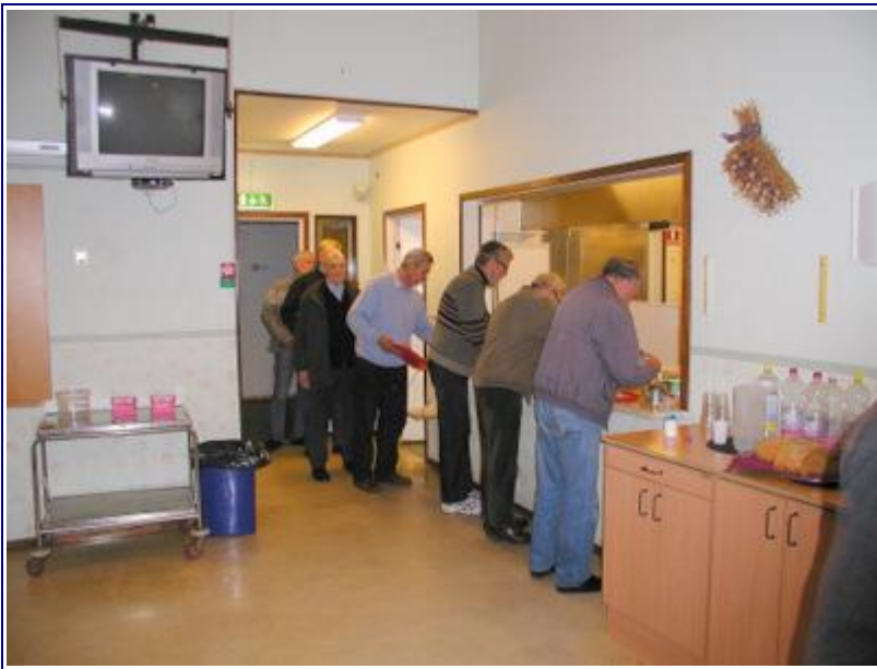
Og maden var absolut værd at stå i kø for.