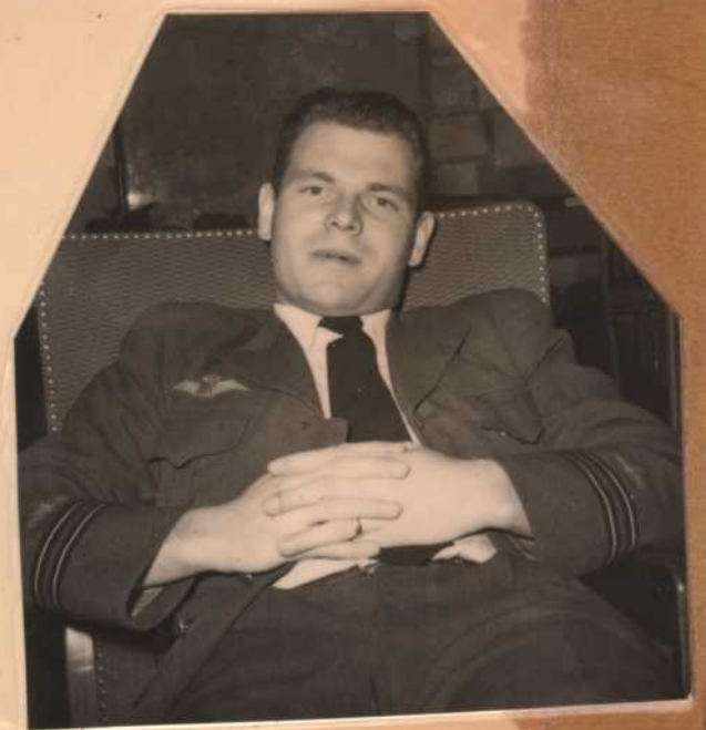
THE OLD MAN "HEN"