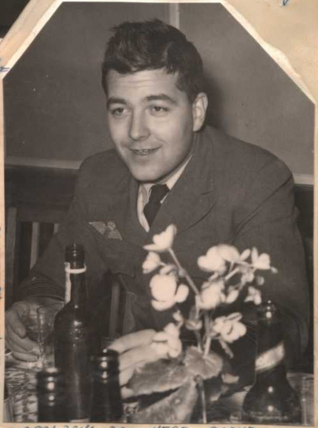
HAPPY DAYS ARE HERE AGAIN.

lidt til, nogen sagde at man til stadig hed på gæst inde i barer, hvor man andre påstod at man var gået, sergent- mæssig, da der var mere at drikke der. Des + Per opdagede man slut ikke - de drak kaffe. Jeg selv var naturligvis den eneste der drak - sodavand, men jeg havde de også på et eller andet tidspunkt fået Kp. Beretning til bordet, så det var med at opføre sig pænt. Vi fik forresten byg- get alle tiders hørsejane på et par tårne; den gav et mægtigt