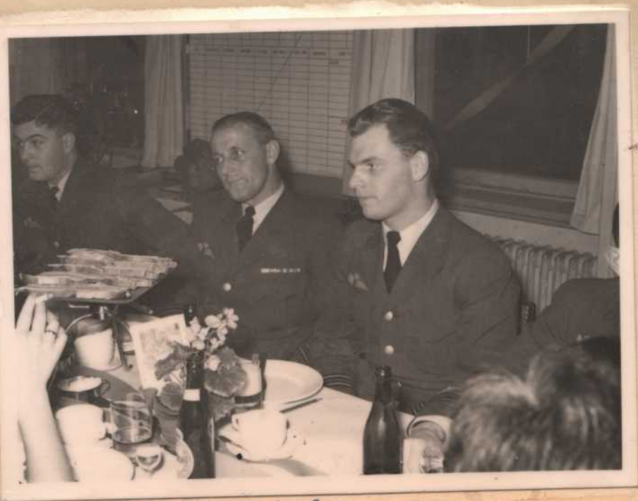
Ege - og grønbeke - væn