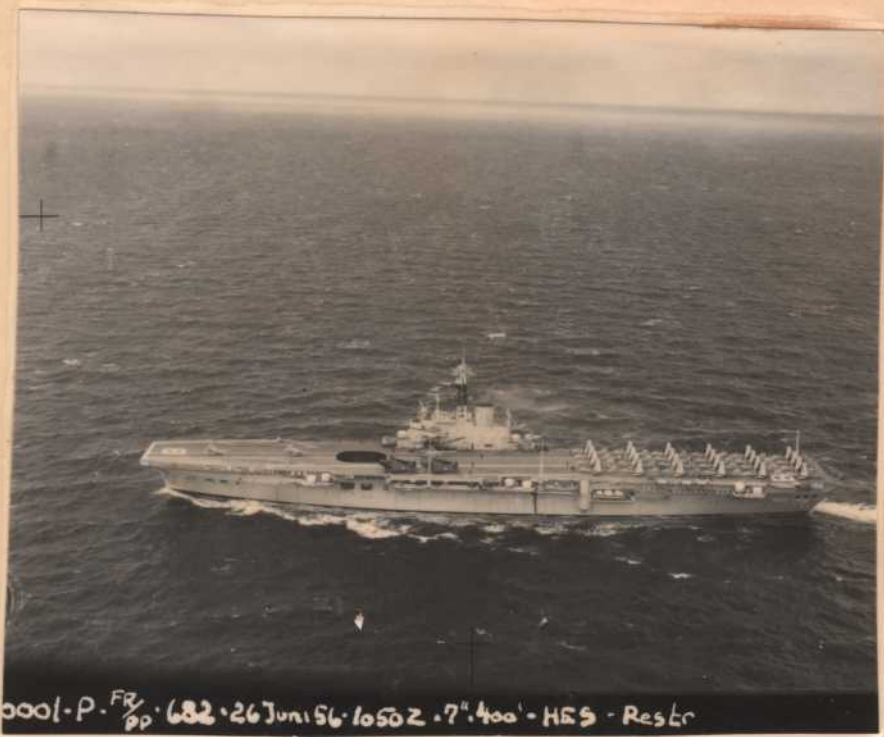
0001-P. FR/PP. 682. 26 Jun 56. 1050Z. 7° 40' - HES - Resto