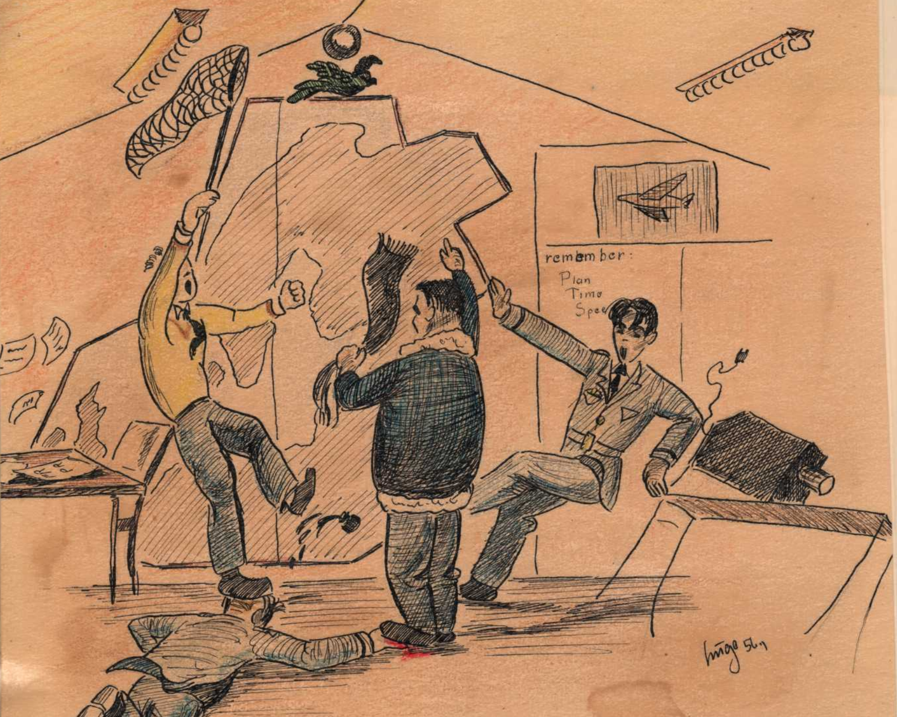
Nuv. Position: Nord f. Nordkap.

I midten af februar begyndte Ege at studere om en papegoje til flighten, - en slags maskot - og da der ikke var langt fra tanken til handling, blev en ekspedition til Hornum under ledelse af Eggens og efter et livligt udtalelse blev bragtes omtalte dyr med diverse tilbehør. At dyret var blevet for vid og sans forstær man ud marked, når man tager