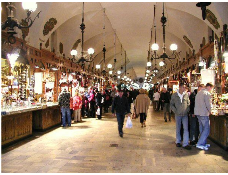
Den smukke og spændende basargade.