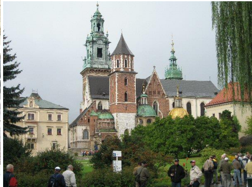
Katedralen set nede fra byen - -