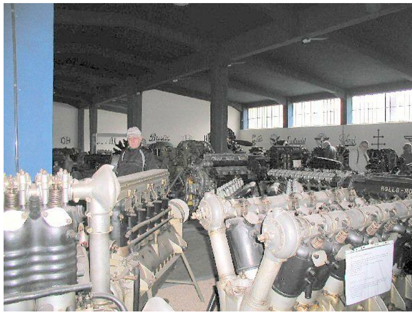
Museet har en meget stor og meget fin samling af flymotorer