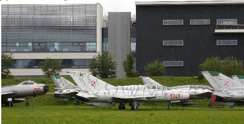
Forskellige versioner af MiG-21 Fishbed

Det polske museum rummer rigtig mange spændende fly og flyrelaterede ting.