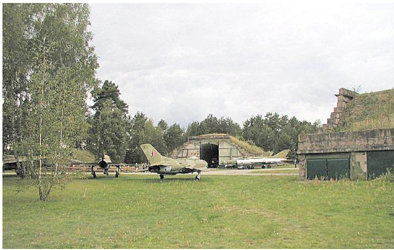
Fra besøget i Finowfurt.