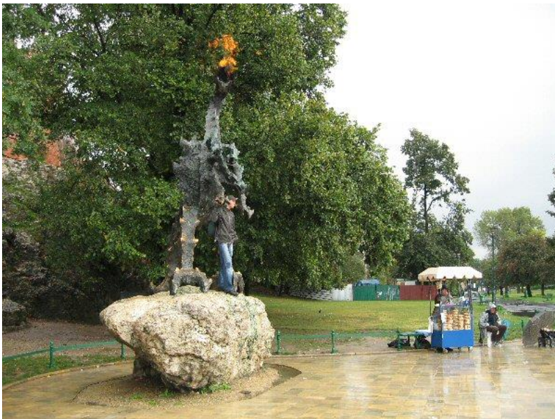
Den ildsprudende drage er for Krakow, hvad Den lille Havfrue er for København.