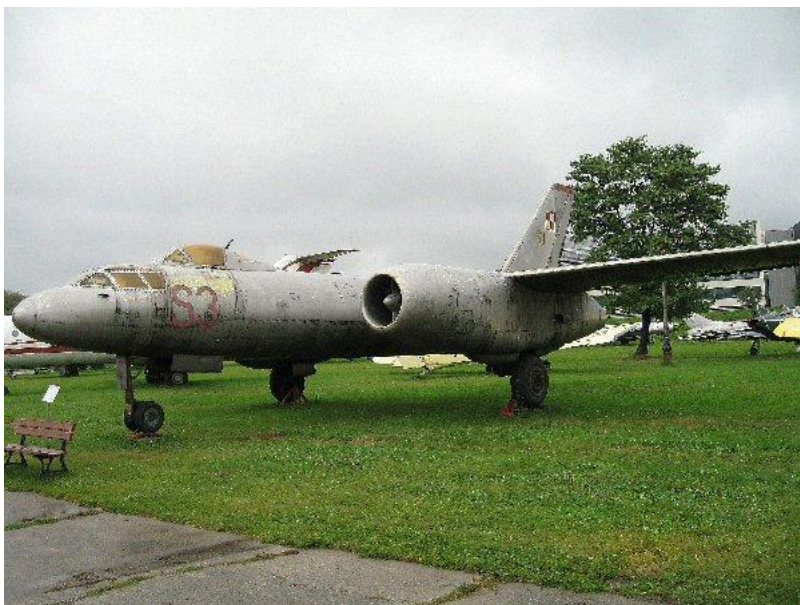
En noget særpræget udgave af Il-28 Beagle

En del af flyene nåede aldrig ud over eksperimentalstadiet.