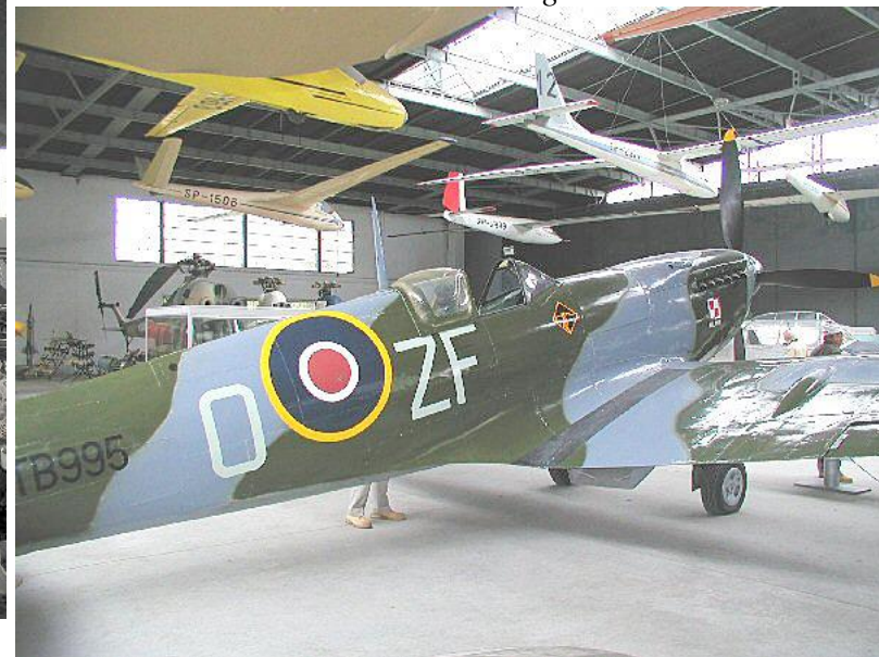
indsats i RAF under anden verdenskrig.

Om eftermiddagen fik vi en rundvisning i Krakow by, og en sød kvindelig turistguide viste os rundt på Carmex Castle med tilhørende Kathedral, hvor konger og biskopper ligger begravet i sarkofager. Under rundvisningen fik vi en grundig indføring i Polens historie.