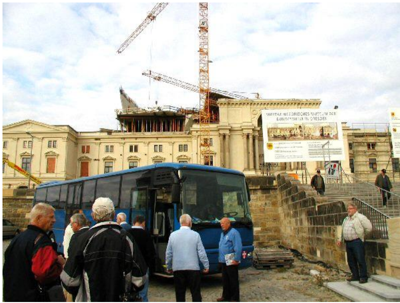
Det store militære museum i Dresden var under

tjekkede vi ud kl. 0700 for at komme til Dresden i Tyskland. Her besøgte vi et kæmpe museum, som var under opbygning i historiske bygninger - selvom det var begrænset, hvad vi fik at se, gav det appetit på et senere besøg. Turen gik derefter tilbage til Cottbus, hvor vi blev tjekket ind på samme hotel som på udrejsen (et rigtig godt valg) .