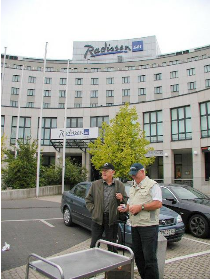
Hotellet i Cottbus og herunder indtjekningen

Efter 14 timer og 15 minutters kørsel i bus - for dem fra Aalborg - tjekkede vi ind på hotellet og fik en dejlig tre retters menu.