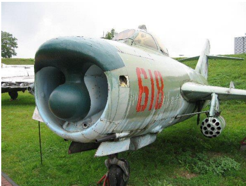
En god opgave for flykendingseksperter.

175 eksemplarer blev der fremstillet af PZL M-15 Belfegor, der er det eneste jetdrevne sprøjtefly, der nogen sinde er fremstillet.