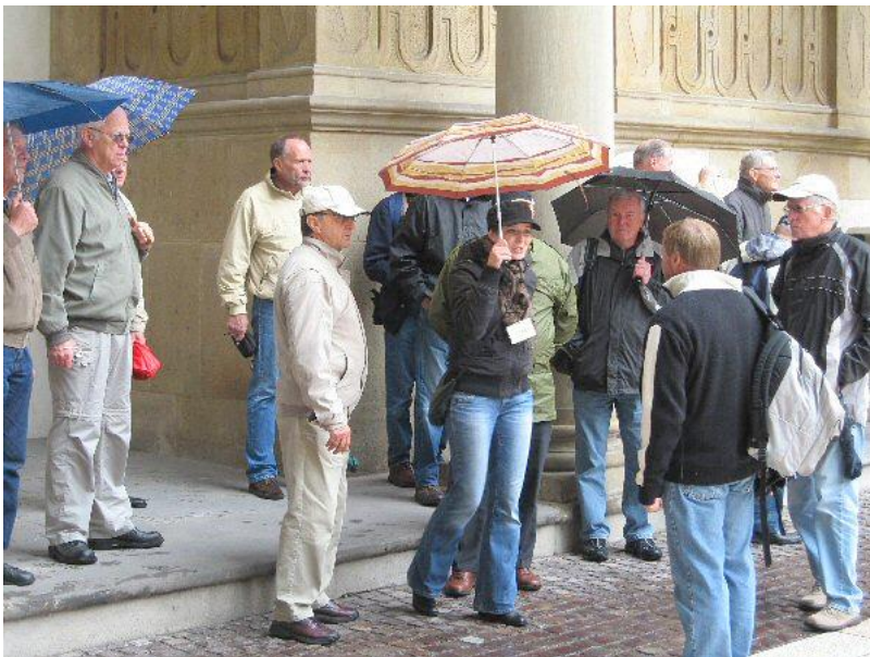
Desværre var vejret ikke det bedst tænkelige til en bytur.

Også den gamle kongeby Krakow er absolut et besøg værd. Det gamle kongeslot med katedralen er en virkelig smuk oplevelse.