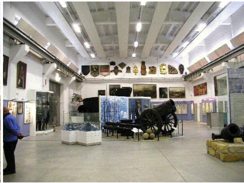
en omfattende ombygning