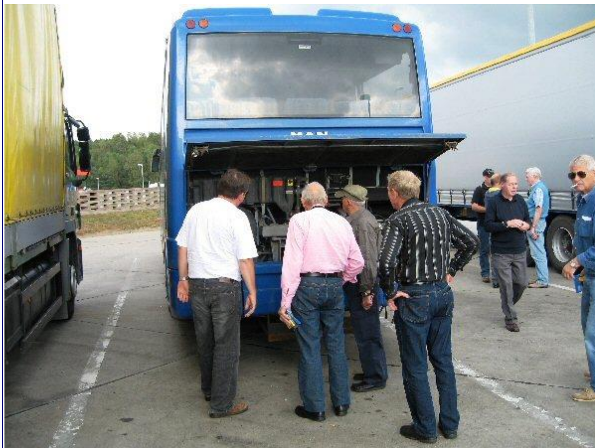
Der er noget galt med motoren