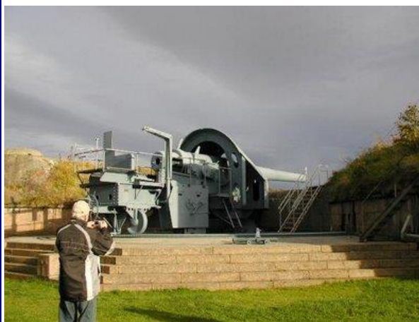
Kanonstillingen på Oscarsborg