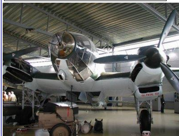
Tre af guiderne på flyvevåbnets museum

Det tyske bombefly Me-111 spillede en vigtig rolle den 9. april 1940.