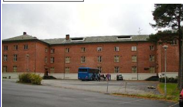
Hostel i Halden