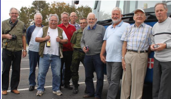
Holdet fra Skrydstrup

Efter ankomsten til Oslo ved 1830 tiden kørte vi til vores overnatningssted, en nedlagt kaserne, der nu var moderniseret og indrettet som Hostel (vandrehjem). Det ligger tæt på en by ved navn Halden, og vi var ca. et par timer undervejs. Efter indkvartering i dobbeltværelser sov alle vist godt denne nat.