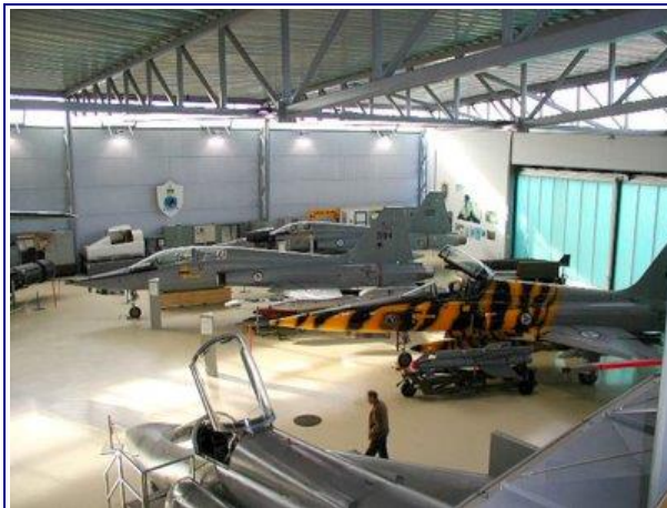
Det norske flyvevåbens museum

Området er fortsat militært, og det daglige vagthold består af Kongens Garde. Forsvarsmuseet, Hjemmefrontsmuseet og Forsvarsstaben har lokaler på AKERHUS FÆSTNING.