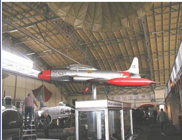
Det imponerende Garnisonsmuseum i Aalborg