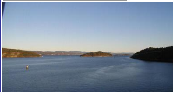
Indsejlingen gennem Oslofjorden er en utrolig smuk oplevelse