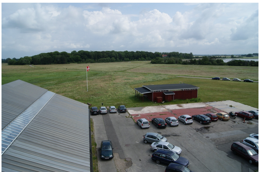
Et kig op mod det gamle hovedkvarter, som først Rigspolitechefen og nu fra 1. januar i år Dansk Røde Kors har overtaget. Læg mærke til Dannebrog, som er blevet rettet helt ud af den kraftige vind.

Vi klatrede en tur op i kontrolløret. Derfra var der et fantastisk overblik over hele området og ud over Avnø Fjord. Det var tydeligt, at intet fly ville kunne starte fra flyvefeltet. Store vandpytter og små søer sammen med højt græs forhindrede, at man kunne få den tanke at starte herfra. Vi lod blikket glide ned at området og hvad så vi? Skolehangaren er borte. Det samme er telthangaren, benævnt Bessonneau-hangaren. Alle bygningerne, der rumme kontorer og Brand- og Redning er væk. Ser man længere sydpå er barakkerne, som blev opført i 1930 og taget i brug i 1931 væk. Lederen af Flyvevåbnets Historiske Samling, seniorsergent Lars