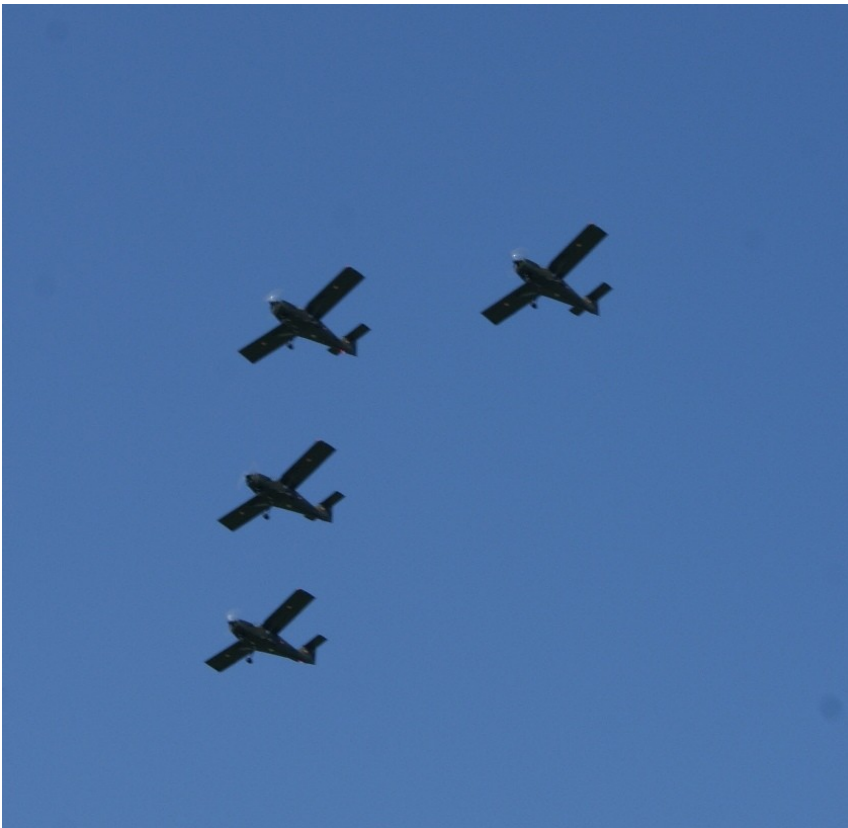
Baby Blue i en næsten perfekt "Finger Four Right Formation" på vej ind mod Vordingborg Kaserne, hvor de pensionerede kolleger stod og ventede.

efterfulgt af Flyveskolens formation "Baby Blue" i en næsten perfekt "Finger Four Right" formation.