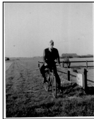
Ankomst til min sidste

Den 1. juni 1957 fik jeg arbejde hos firmaet Møller & Co i Sønderborg, hvor jeg var ansat indtil den 22. august 1997.