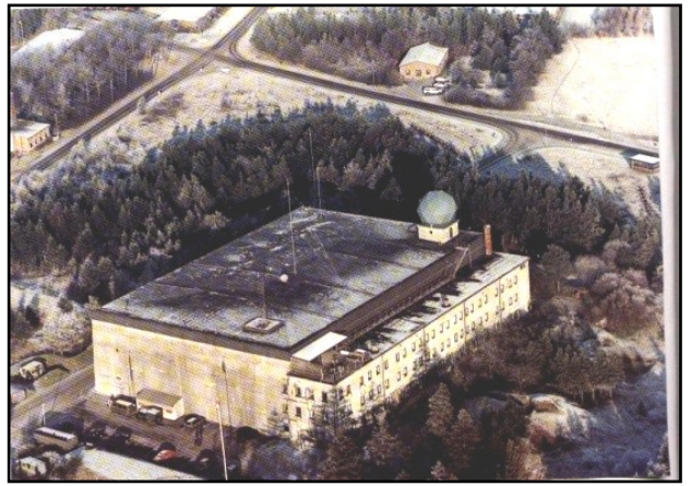
Bunker 1137 i Karup/Gedhus med bl.a. SOC Vest og F.M.

Et opkald kunne f.eks. lyde således: "Fix,Fix,Fix. Capella, Birdsong Blue One calling for fix. Heading 90 degrees, angels 5. Over to Capella for Fix" . Når et sådant opkald hørtes, drejede man på pjeleapparatets rat og fandt minimum-graden, som blev opgivet til plotterne hos Fighter Marshal i SOC'en i Karup. Det samme skete på fixernettes øvrige stationer, og på grundlag af disse pejlinger kunne man i F.M. bestemme flyets position og melde den til piloten. Der måtte højst gå 10 sekunder fra opkald til modtagelse af position. Pejlinger fra fixerstationerne var retvisende, så dér hvor de mødtes fra de forskellige stationer, var det rigtige sted. Var et signal meget svagt, havde man mulighed for at skrue op for højfrekvensen. Man skulle være opmærksom på, at pejlingen ikke var 180 grader forkert.