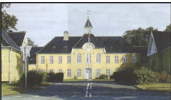
Flyvestation Værløses hovedbygning

Medens vi lå i Jonstrup, kom der et nyt hold rekrutter til uddannelse i lejren. En dag, hvor vi stod nogle stykker i vores kvarter, kom der en rekrut gående forbi med hænderne dybt begravet i lommerne. Jeg fik hurtigt fat i en oversergentvinkel, som jeg havde liggende, og fik den sat på det