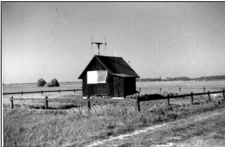
Tønder Fixer. I baggrunden anes Møgeltønder.

På Tønder Fixer var vagterne inddelt som følger: 08.00 - 14.00, 09.00 - 16.00, 14.00 - 18.00 og 18.00 - 08.00. Hver 14. dag havde vi forlænget orlov fra fredag til mandag morgen kl. 08,00. Vi havde megen frihed under ansvar, så vi havde det som blommen i ægget.