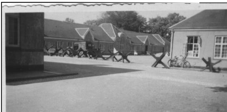
SOC Øst på Flyvestation Værløse

En dag, da jeg havde fri, så jeg en amerikansk F-86A Sabre jetjager nødlande på startbanen. Brandbilerne var kørt frem, men der skete kun materiel skade - heldigvis. (Det var noget med, at landingshjulene ikke var kommet ned).