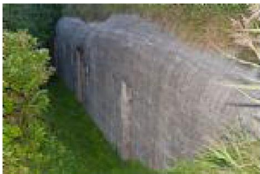
Tysk bunker type 622