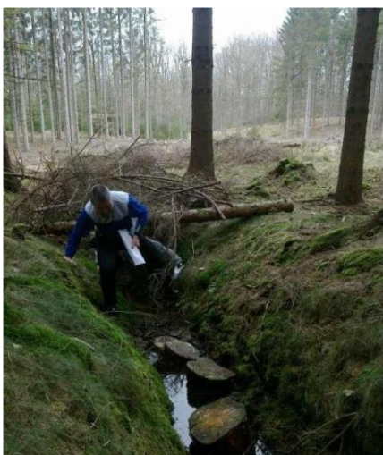
Orienteringsløb kan være en særdeles besværlig og våd sport

Løbet skulle foregå i Vrads Sande, og på dagen viste vejret sig fra sin allerværste side. Det regnede, lynede og tordnede og da der i løbsområdet i forvejen var mange moser og vådområder, blev det et sandt mudderbad. Selvom jeg på sergent kort forinden havde erhvervet terrænsportsmærket, bestående af tre orienterings discipliner samt to håndgranat discipliner, mistede jeg totalt orienteringen mellem post 1 og 2.