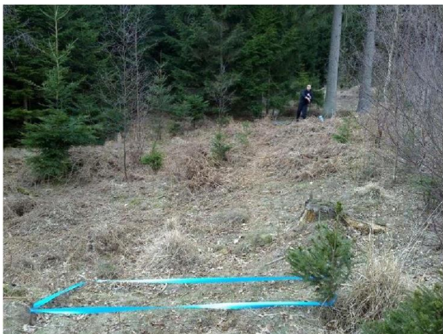
Kast med håndgranat efter skyttegrav

3. eskadrille førte som den eneste eskadrille sine rekrutter op til mærkeprøven i terrænsport (terrænsportsmærket i bronze). Jørgensen var som skolens idrætsleder uddannet og godkendt til at være dommer og dermed også kontrollant ved terrænsportsmærkeprøven.