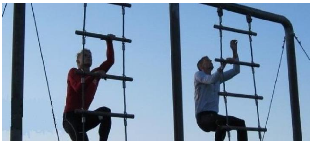
Rebstige på feltbane

militærpolitienhed, hvor jeg fik kommandoen over en halvdeling MP'ere (militærpoliti) hvori også indgik en hundefører. Øvelsen skulle vare i 3 døgn, og vi havde vores kommandocentral i en af de tyske bunkere inde på selve flyvestationen, hvor vi også havde vores kvarter.