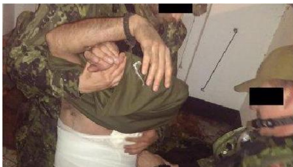
Sanitetstjeneste – forbindelse af såret soldat

I tjenesten omgikkes også alle befalingsmænd og officerer hinanden helt i overensstemmelse med forsvarets krævede omgangsformer, og vi tiltalte hinanden med grad og navn, alt sammen for at understøtte opbygningen af rekrutternes disciplin, men i pauserne og uden for tjenesten eller når blot vi ikke var iagttaget af rekrutterne, omgikkes vi hinanden afslappet og som gode kolleger. Man må næsten kunne sammenligne det med skuespillere på og uden for scenen.