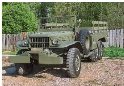
Dodge militær lastbil WC63

På et tidspunkt modtog vi en melding om fjendtlig aktivitet i et område sydøst for Flyvestationen. Jeg kørte med min gruppe i to åbne Dodge lastbiler ud til området, hvor det lykkedes os at overraske og efter en kort ildkamp at tilfangetage en gruppe soldater. Det viste sig at være en gruppe jægersoldater. Jeg vidste, at specielt jægerne skulle visiteres indtil det bare skind for at være sikker på, at de var totalt stripet for våben.