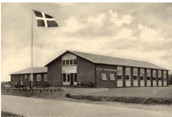
Det gamle soldaterhjem overfor Gedhusvagtten

Efter nogle dage fik vi en tilbagemelding på øvelsens forløb, og jeg kunne med tilfredshed inkassere ros og anerkendelse fra politienheden, som jeg havde været udlånt til, så det var en god start for en ny og helt rutineret sergent.