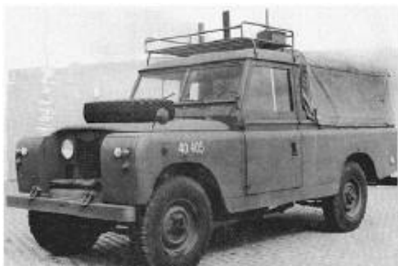
Land Rover 109 serie IIA

Samme kørelærer omskolede mig også til Folkevognsbuss. Det kunne dog gennemføres uden godkendelse af en prøvesagkyndig.