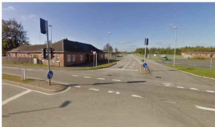
Flyvestation Karup – Gedhusvagten

Den 4. oktober 1971 mødte jeg som nyudnævnt sergent på Flyvestation Karup, hvor jeg skulle tiltræde tjeneste på rekrutskolen. Jeg meldte mig ved skolestaben, som sammen med 4. rekruteskadrille havde til huse i det tidligere flygtningehospital, i Gedhus. Her skulle de første formalia klares, bl.a. skulle jeg have udleveret min udrustning, som var sendt fra Værløse til Karup. Jeg fik også et værelse på flyvestationen, som var gratis i 3 måneder.